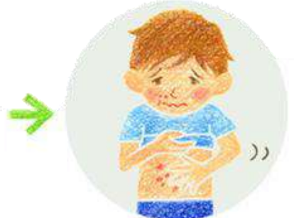
あっという間に体のあちこちに「飛び火」する