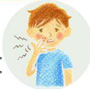
皮膚の一部にできた水ぶくれやただれが...

『とびひ』は感染力が強い為、処置が必要です。覆えない場所に出来てしまうと登園できません。広がる前に、早めの受診をお願いします。