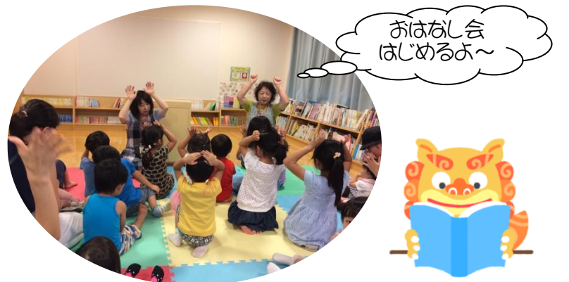
おはなし会 はしめるよ~

おはなし会も毎日設定され、「あしびなあ」も、毎月 第4火曜日の午前中に参加しています!